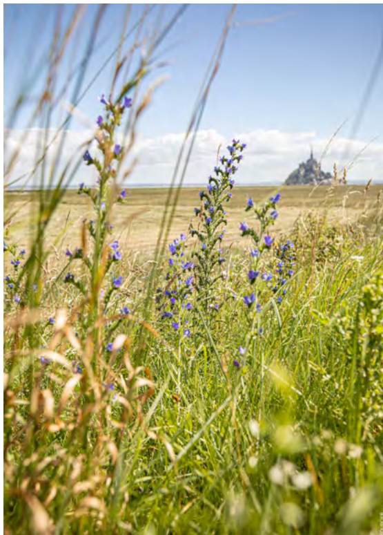
Les polders-S Bourcier

La Communauté de communes met en place une campagne de déclaration des meublés de tourisme pour préserver l'équité de traitement des hébergements déclarés et soumis au reversement de la taxe de séjour et les hébergements non déclarés.